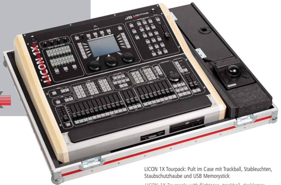
LICON 1X Tourpack: Pult im Case mit Trackball, Stabelluchten, Staubschutzhaube und USB Memorystick